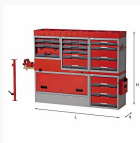
5006 E5 - Assortment for left side