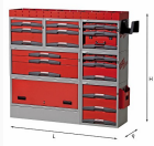
5006 E8 - Assortment for left side