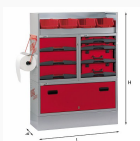
5006 EF1 - Assortment for right or left side