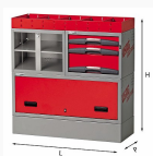
5006 EF6 - Assortment for left side