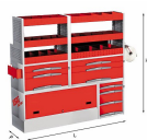
5006 C4 - Assortment for left side