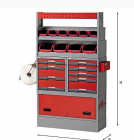
5006 E9 - Assortment for right side