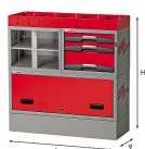
5006 EF6 - Assortment for left side