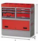
5006 E12 - Matrix - Assortimento lato sinistro