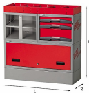
5006 EF6 - Assortimento lato sinistro