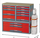
5006 E3 - Assortimento retro schiena