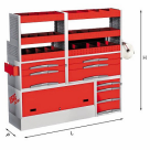
5006 C4 - Assortimento lato sinistro