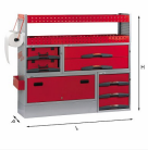
5006 C2 - Assortimento lato sinistro