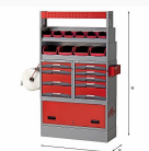
5006 E9 - Assortimento lato destro