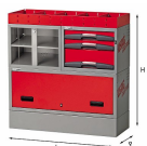
5006 EF6 - Assortimento lato sinistro