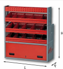
5006 EF4 - Assortimento lato destro o sinistro