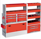
5006 C5 - Matrix - Assortimento lato sinistro