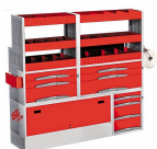
5006 C4 - Matrix - Assortimento lato sinistro