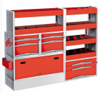
5006 C5 - Matrix - Assortimento lato sinistro