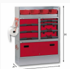
5006 EF1 - Assortimento lato destro o sinistro