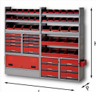
5006 E2 - Matrix - Assortimento lato sinistro