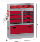
5006 EF1 - Assortimento lato destro o sinistro